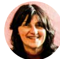
St. Gumbertus Christine Kaas ☎ 14890