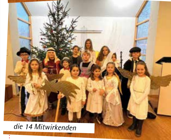
die 14 Mitwirkenden