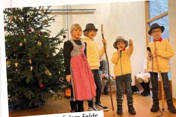
die Hirten auf dem Felde