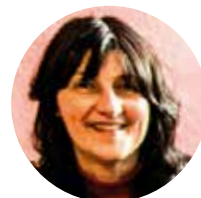
St. Gumbertus Christine Kaas ☎ 14890