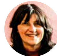
St. Gumbertus Christine Kaas ☎ 14890