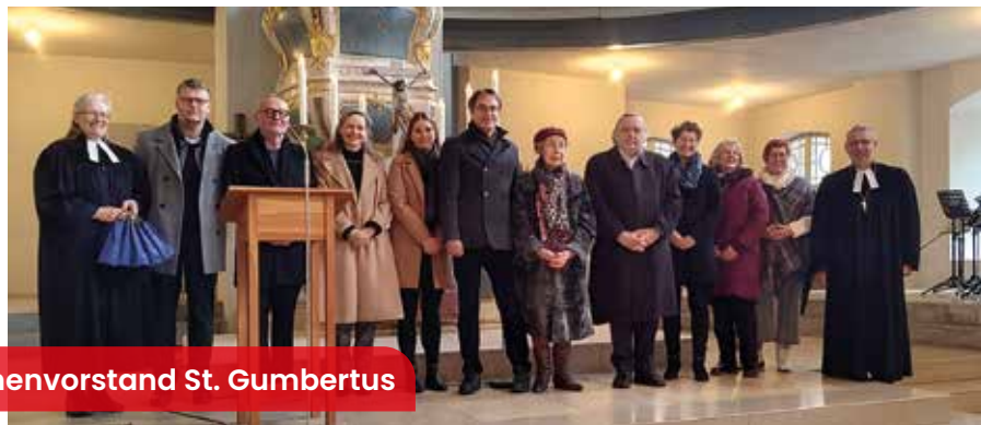
Kirchenvorstand St. Gumbertus