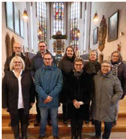
Kirchenvorstand St. Johannis

Nach der KV-Wahl am 20. Oktober und den Nachberufungen wurden die Kirchenvorsteherinnen und Kirchenvorsteher der beiden Innenstadtgemeinden in den Gottesdiensten am 1. Advent in ihr Amt eingeführt und